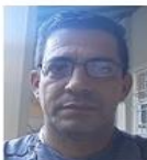
Vicente Ignacio Álvarez Diseño

Francisco Varona No. 309.Las Tunas CP: 75100 Teléfono: (31) 371376 Email: unhic-lastunas@cubarte.cult.cu